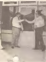
...epta entrega di kazerne nobo ...colas (December 1978)